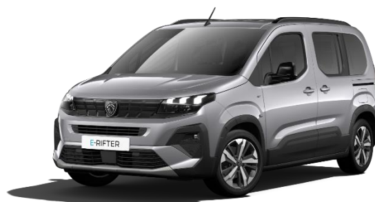
Grigio Artense M0F4 – Opzione a 650€