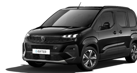
Nero Perla M09V – Opzione a 650€