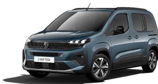
Blu Kiama M0M6 – Opzione a 650€