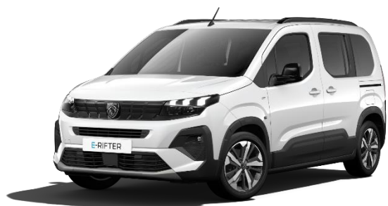
Bianco Kaolin POPR – gratuita