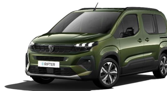
Verde Sirkka M04Q – Opzione a 650€