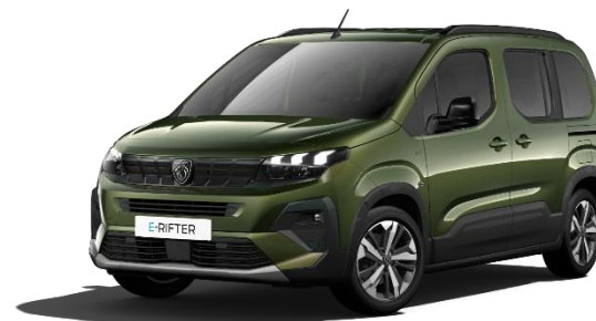
Verde Sirkka M04Q – Opzione a 650€