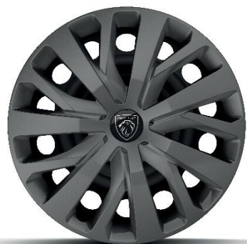
Cerchi in acciaio da 16'' con copricerchio