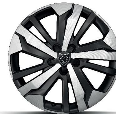
Cerchi in lega di alluminio diamantati da 17''