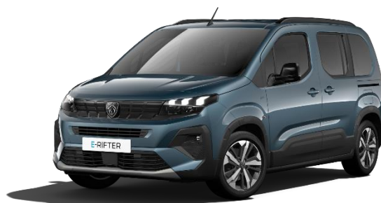
Blu Kiama M0M6 – Opzione a 650€