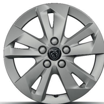
Cerchi in lega di alluminio da 16''